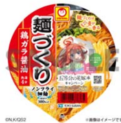
※告知パッケージ例

この度の企画は、「麺づくり」シリーズを対象としたキャンペーンで、TVスペシャルアニメ「五等分の花嫁*」とのコラボレーションにより実現しました。本キャンペーンでは、対象商品をご購入いただき、フタの表面に記載の二次元コードを読み取り、フタの裏面に記載のシリアルコードを入力することでポイントが取得できます。1商品が1ポイントとなり、ポイント数に応じて5コースから選びご応募いただけます。応募者の中から抽選で合計750名様に、TVスペシャルアニメ「五等分の花嫁*」オリジナルデザインのグッズが当たります。